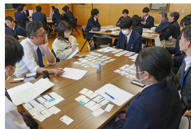
キックオフミーティング

※毎年生徒達に、プロジェクトやお酒を呑んでくださる方への想いを漢字一文字で表わしてもらい、そこから商品名を決定しています。