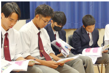
ラベルデザイン検討

手刈り班とコンバイン班（機械刈り）に分かれ、それぞれ作業を行います。収穫した酒米は同校で袋詰めを行い、ホクレンでの精米作業を経て、高砂酒造へ納入されます。